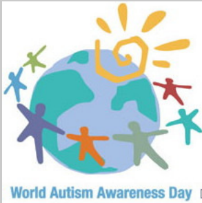
World Autism Awareness Day

Der Gedenktag wurde 2007 von der UNO ins Leben gerufen und soll die Wahrnehmung von autistischen Störungen in der Gesellschaft sensibilisieren.